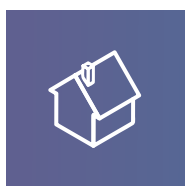
NUMÉRISATION ET MODÉLISATION 3D

Découvrez une gamme de prestations clés en main et sur-mesure ; au service de la performance des acteurs du bâtiment :